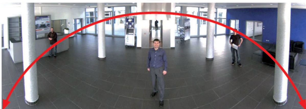
Lückenloser Erfassungsbereich: Die wandmontierte i25 bietet einen 180°-Panoramablick.