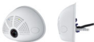
Mit 15° Objektivneigung